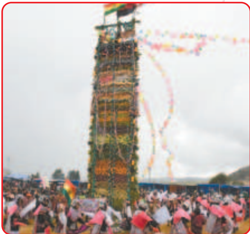
Tarabuco es reconocido por su celebración de la Gran Pukara Pujllay.