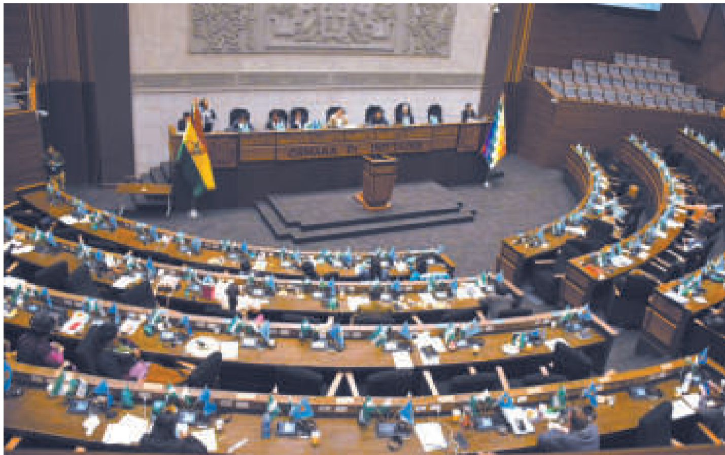
El pleno de la Cámara de Diputados en la Asamblea Legislativa Plurinacional de Bolivia.