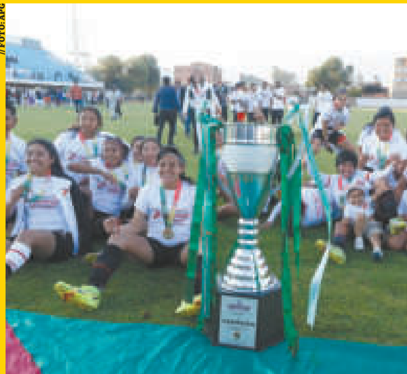
Jugadoras de Always Ready después de conseguir el título nacional.