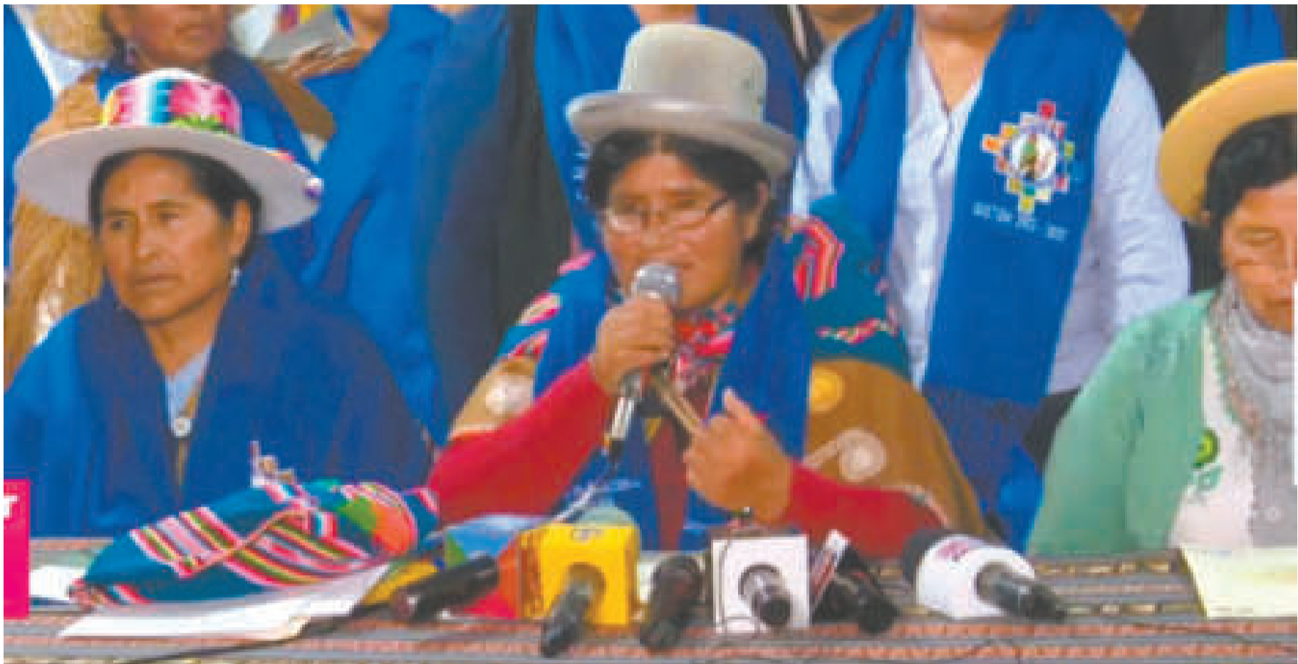
Conferencia de prensa de la directiva, luego del ampliado en La Paz.