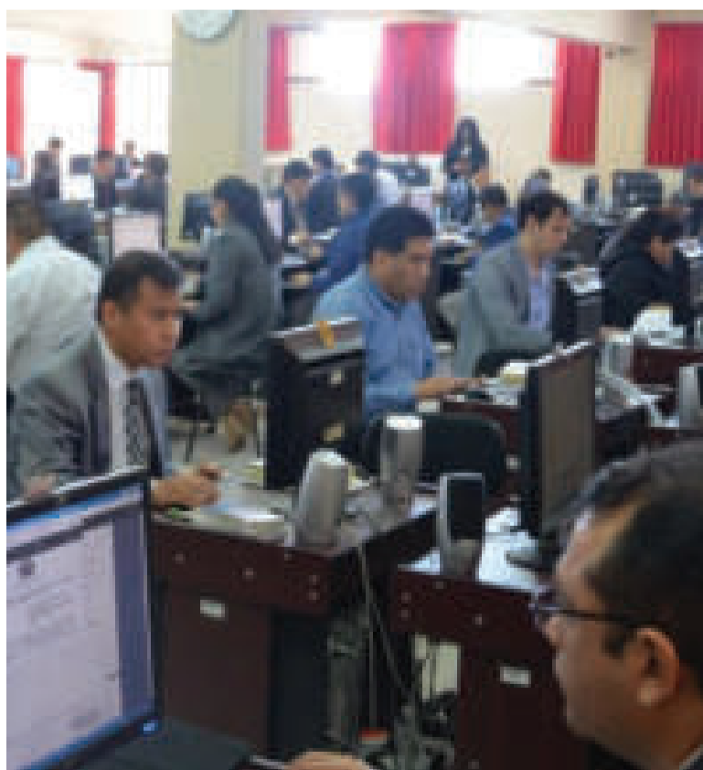
Un curso impartido para los nuevos fiscales.