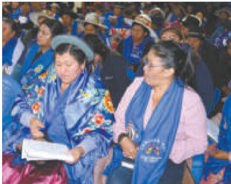
Ampliado ordinario de las mujeres 'Bartolina Sisa'.

"Nos mantenemos en la unidad y no permitiremos divisiones ni fracturas dentro de nuestra organización y más aún dentro del Instrumento Político por la Soberanía de los Pueblos (MAS-IPSP), porque ha costado vidas y trabajaremos por la unidad del pueblo, por ello la mayoría de los departamentos decidimos mantener la unidad y no asistir al congreso