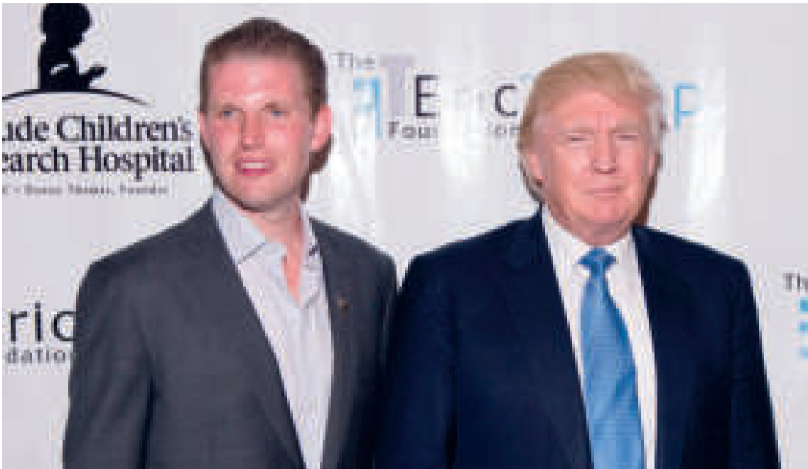
Donald Trump junto a su hijo Eric.