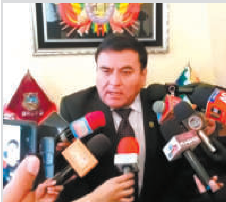
El fiscal departamental de Oruro, Aldo Morales.