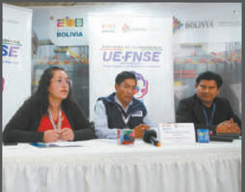
Autoridades de la comisión organizadora en el lanzamiento de la convocatoria.

Categoría A: 200 metros; la clase B: 600 metros; la categoría C: 1.000 metros y D: 1.300 metros.