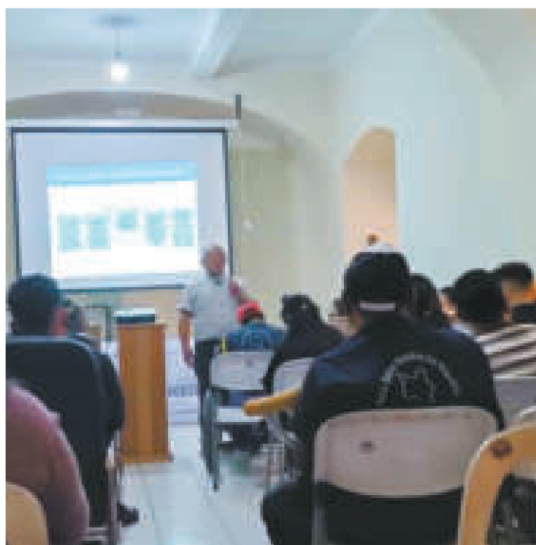
Socialización de la Ley 223 en Cochabamba.

ES EL NÚMERO DE LA LEY socializada en el taller de capacitación.