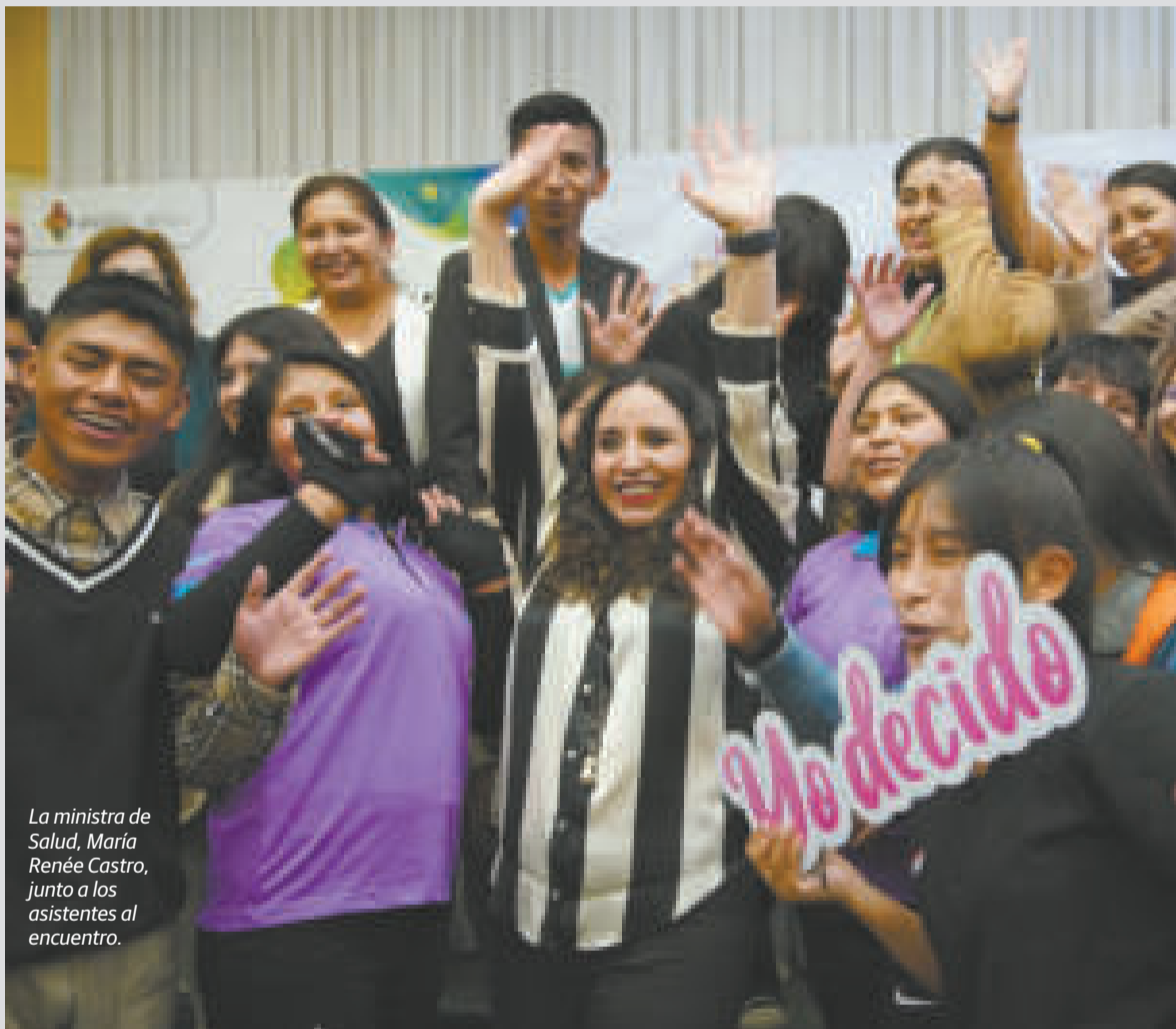
La ministra de Salud, María Renée Castro, junto a los asistentes al encuentro.

Sostuvo que el proceso de las AIDA implica la sensibilización y la capacitación del personal de salud con un enfoque de género, de derechos y es por eso que “nosotros también hemos invitado al Ministerio de Justicia, porque la lucha contra el embarazo adolescente no es una lucha que solamente le corresponde al Ministerio de Salud, es una lucha que todos”.