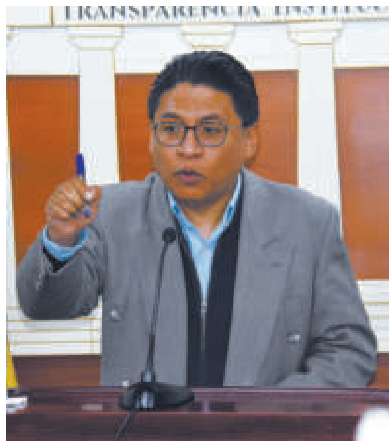
El ministro de Justicia, Iván Lima, durante una conferencia de prensa.

Al respecto, se informó que se presentaron acciones constitucionales para garantizar el debido desarrollo del proceso electoral.