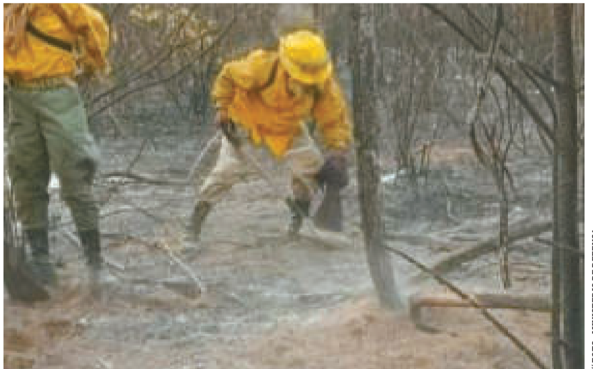
Bomberos forestales ejecutan tareas de enfriamiento en el oriente boliviano.