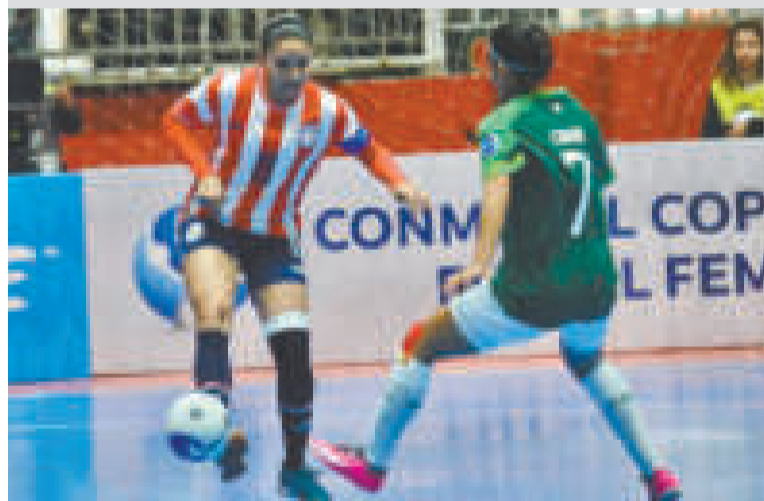
Una escena del cotejo entre las selecciones de Paraguay y Bolivia.

Hoy disputará el cotejo más difícil del torneo al enfrentarse al actual campeón Brasil. Jugarán desde las 15.00 HB.