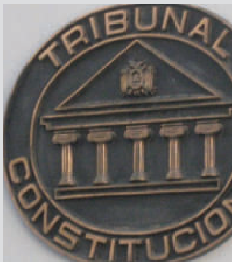
Logo del Tribunal Constitucional Plurinacional.

El TSJ, máxima institución del Órgano Judicial, presentó al TCP una consulta de control previo de constitucionalidad sobre el artículo 2 y la disposición adicional sexta del proyecto de Ley N° 144/2023-2024, por existir duda razonable y considerarse contrario a lo previsto en algunos artículos de la Constitución Política del Estado (CPE). El documento señalado además resalta la suspensión de plazos procesales en las instituciones judiciales a partir del 2 de enero hasta tener posesionadas a las nuevas autoridades electas, quedando a cargo en ese tiempo de transición personal subalterno.